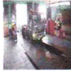
Left